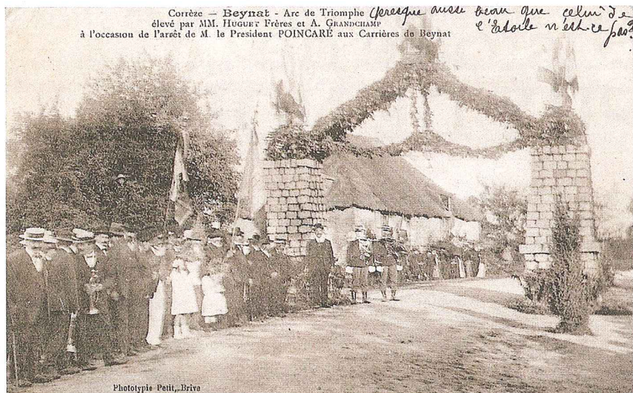
Corrèze — Beynat - Arc de Triomphe élevé par MM. HUGUET Frères et A. GRANDCHAMP à l'occasion de l'arrêt de M. le Président POINCARÉ aux Carrières de Beynat Phototypie Petit, Briva Relégués devant la chaumière d'un cantonnier les habitants de Puy de Noix. Carte postale de la « Collection Jean-Paul Toulzat » (Avec l'aimable autorisation de sa famille).

« La loi n° 2013-428 du 27 mai 2013 modernisant le régime des sections de commune a eu pour conséquence de supprimer la commission syndicale de Puy de Noix, c'est à présent un Comité Consultatif ouvert à tous les habitants qui participe à la gestion communale du budget de la section de Puy de Noix (entretien des pistes, achats de matériels collectifs, réalisations culturelles ou environnementales) ». Nouveauté : fin 2018, la Société des Carrières du Massif Central abandonne définitivement l'exploitation