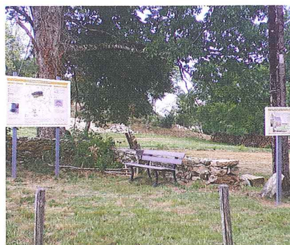
Espace historique de Puy de Noix.

Dès 2010, habitants et employés municipaux dégagent les pierres tombales du cimetière et l'emplacement de l'ancienne chapelle ruinée. Le Centre de Formation Professionnelle et de Promotion Agricole de Naves reconstruit les anciens murs de pierres sèches, aménage des parterres de plantes médiévales. Complété par des bancs, l'espace devient pédagogique avec l'implantation de deux panneaux d'information mis en scène par les créateurs beynatois Double Je, l'un dévoilant les nombreux sites de cette commanderie, l'autre le croquis de l'ancienne chapelle et du cimetière. En 2014, la municipalité prend le relais, crée la boucle de randonnée n°5 « Le territoire de l'ancienne commanderie de Puy de Noix », depuis inscrite aussi dans le plan départemental des itinéraires de promenades et de randonnées (PDI PR) et très fréquentée. En 2020, les travaux de sécurisation et de délimitation de ce site patrimonial important de la commune vont reprendre.