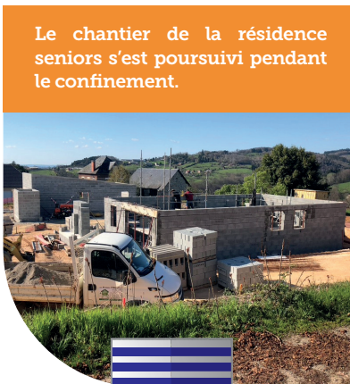
Le chantier de la résidence seniors s'est poursuivi pendant le confinement.