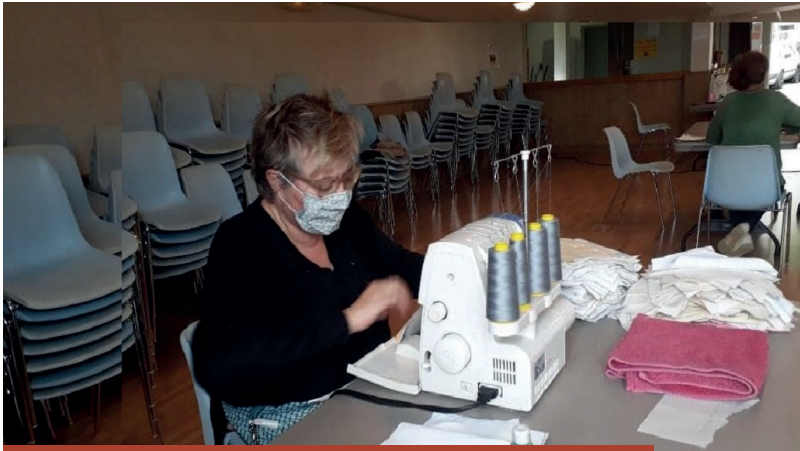
Les couturières beynatoises ont réalisé des masques en tissu pour la population et des surblouses pour les professionnels de santé.