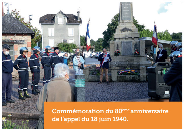
Commémoration du 80 ème anniversaire de l'appel du 18 juin 1940.