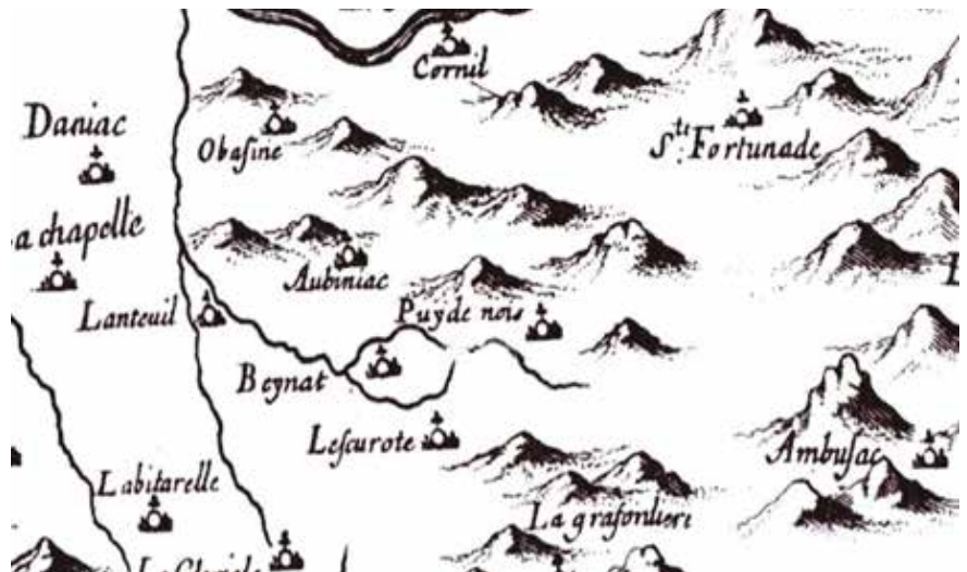
Extrait de la Carte du Pays et Vicomté de Turenne /Sr du Bac de 1640 (Arch. Dép. Corrèze, 1Fi - 652)

D'où vient ce nom singulier ? Il faut remonter au début du XIII e siècle quand cette colline rocailleuse, dénudée, inhabitée devient le siège d'une commanderie religieuse. Il faut bien lui trouver un nom. Il y en aura plusieurs, au fil des documents officiels : au début en occitan ancien « Pueg denut » (Puy dénudé), en latin « Puidunum » ou même « Podium nuciis » et la confusion avec les noix ! Puis, en occitan parlé « Pedenou » et définitivement en français « Puy de Noix ».