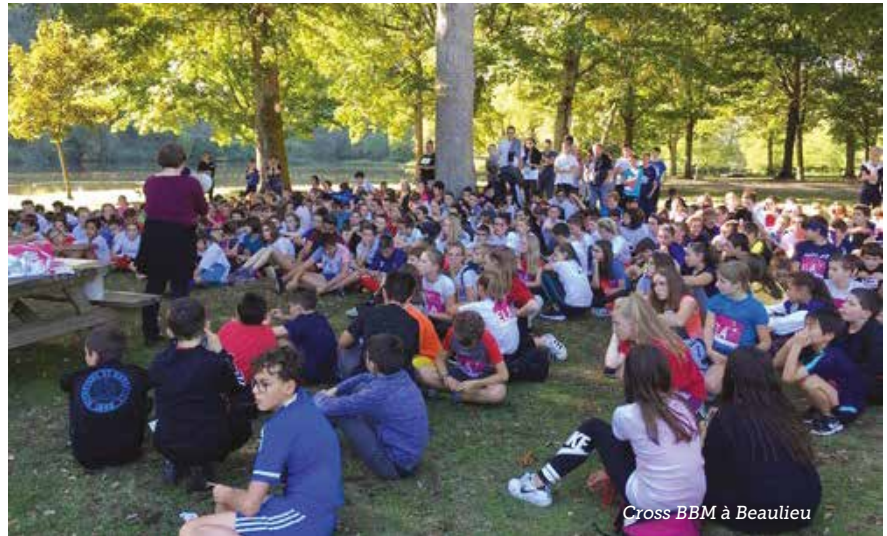
Cross BBM à Beaulieu

Au niveau des actions entreprises les collégiens ont participé le lundi 23 septembre à l'opération « Nettoyons la nature ». À cette occasion, les élèves de 5 e se sont rendus au lac de Miel pour une balade qui a permis de collecter beaucoup de déchets abandonnés, et de développer leur sens de la citoyenneté. Toujours en matière d'environnement, dans le cadre de l'éducation au développement durable, un atelier a été mis en place le lundi pendant la pause méridienne. Les élèves et les personnels du collège se mobilisent aussi (en concertation avec l'école) en faveur d'une demande de labellisation E3D auprès du rectorat. Le projet se construit actuellement et toutes les idées des éco-délégués (1 par classe) viennent l'enrichir. Ces derniers mois, certains élèves ont tressé des éponges avec des chaussettes esseulées ou des leggings troués (projet Tawashi). D'autres, après avoir médité sur l'importance des arbres, ont créé des affiches pour partager le fruit de leurs découvertes. Entre novembre et les vacances de Noël s'est tenu par ailleurs un atelier « déco de Noël » écologique. Du 2 au 4 octobre a eu lieu au Centre