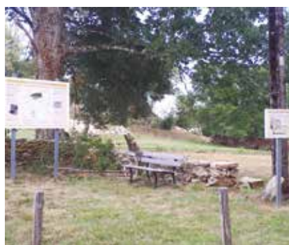
Espace historique de Puy de Noix.

Dès 2010, habitants et employés municipaux dégagent les pierres tombales du cimetière et l'emplacement de l'ancienne chapelle ruinée. Le Centre de Formation Professionnelle et de Promotion Agricole de Naves reconstruit les anciens murs de pierres sèches, aménage des parterres de plantes médiévales. Complété par des bancs, l'espace devient pédagogique avec l'implantation de deux panneaux d'information mis en scène par les créateurs beynatois Double Je, l'un dévoilant les nombreux sites de cette commanderie, l'autre le croquis de l'ancienne chapelle et du cimetière. En 2014, la municipalité prend le relais, crée la boucle de randonnée n°5 « Le territoire de l'ancienne commanderie de Puy de Noix », depuis inscrite aussi dans le plan départemental des itinéraires de promenades et de randonnées (PDIPR) et très fréquentée. En 2020, les travaux de sécurisation et de délimitation de ce site patrimonial important de la commune vont reprendre.