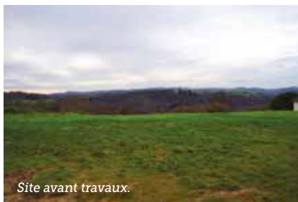
Site avant travaux.

Les travaux de décaissement et de voirie seront réalisés par la municipalité. S'ensuivront les constructions par l'organisme « Corrèze Habitat ». Le chantier devrait durer une année et les premiers locataires prendront ensuite possession de leur logement à la fin 2020. À noter que le choix des locataires est opéré par « Corrèze Habitat » lors des commissions HLM auxquelles participent des élus beynatois.