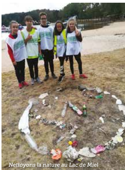
Nettoyons la nature au Lac de Miel

Le mardi 15 octobre, dans le cadre de l'opération StartUp, les élèves de 3 e ont visité le Fablab "EasyCeram" de Limoges. Ils ont pu échanger avec les animateurs de ce Fablab spécialisé dans le prototypage d'objets en céramique, visiter les installations et voir les différents moyens mis à disposition des abonnés pour concevoir et réaliser leurs prototypes. Ils se sont aussi prêtés à un jeu de rôle où ils devaient se mettre dans la peau d'ingénieurs devant concevoir les objets de demain dans différents domaines : aéronautique, agroalimentaire, écologie, domotique, sécurité... et enfin, présenter le fruit de leur réflexion à l'ensemble du groupe.