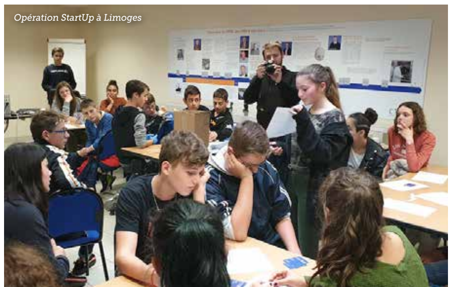
Opération StartUp à Limoges